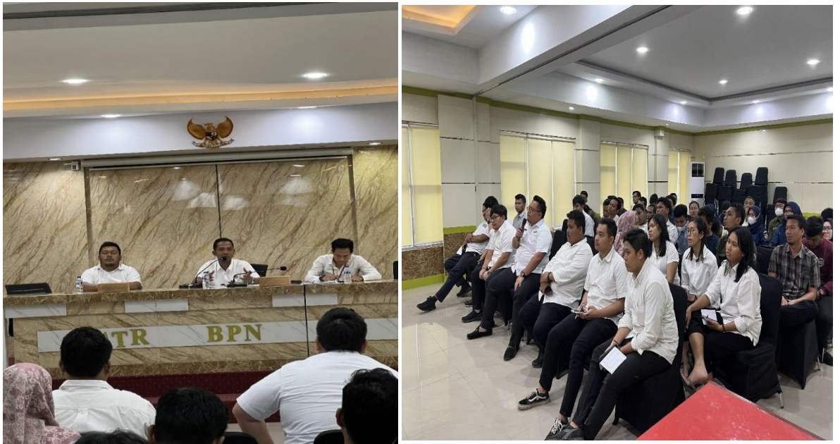
Gambar 6: Rapat monitoring dan evaluasi kegiatan validasi buku tanah dan bidang tanah