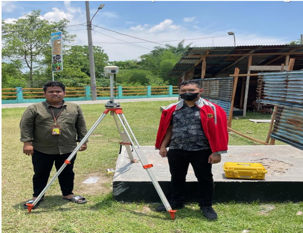
Gambar 5 : Kegiatan tim fisik melakukan penelitian lapangan untuk validasi bidang tanah