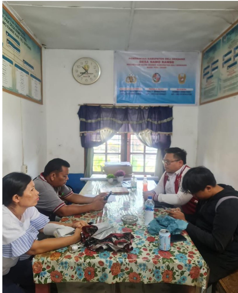
Gambar 3 : Sosialisasi dan Kordinasi dengan Stakeholder

Sebelum melakukan kegiatan lapangan dilakukan sosialisasi dan kordinasi kepada pihak kelurahan selaku stakeholder guna kelancaran pelaksanaan kegiatan di lapangan. Kordinasi dilakukan agar tercipta sinergitas antara kantor pertanahan dan kelurahan agar tercapai kesepahaman atas kegiatan aksi perubahan yang akan dilaksanakan.